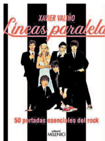
Portada de 'Líneas paralelas'.

pop rock durante el franquismo (Milenio, 2011)