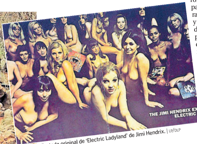
Portada original de 'Electric Ladyland' de Jimi Hendrix.